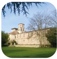
L'abbaye et l'abbatiale de Vertheuil [L-11]

Replongez dans l'atmosphère du Moyen-Âge au travers d'une visite de cette tour qui abrite un petit musée d'histoire locale avec outils anciens, tonnellerie et objets provenant de fouilles archéologiques.