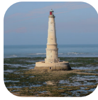
Le phare de Cordouan [A-5]

Cordouan, roi des phares et phare des rois, fut bâti sur l'ordre d'Henri III à l'emplacement d'une tour du XIII ème siècle. L'édifice, d'une architecture novatrice pour son temps, constitue une véritable prouesse technique. Consolidé et restauré à l'époque de Louis XIV, il fut surélevé en 1789.