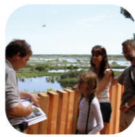
La réserve naturelle de l'étang de Cousseau [S-4]

Un guide naturaliste vous présentera des paysages, une flore et une faune d'une extrême richesse !