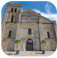
La basilique Notre-Dame-de-la-Fin-des-Terres et le village ancien de Soulac-sur-Mer [C-5]

Du haut de ses 301 marches, vous êtes émerveillé par la vue à 360° sur l'estuaire de la Gironde et la Pointe de Grave.