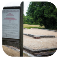
Le site archéologique de Brion [K-11]

Lors de votre passage, n'oubliez pas de vous initier à la pêche à la crevette grise de l'estuaire depuis le carrelet de pêche, filet descendu horizontalement au moyen d'un treuil depuis un ponton avec une cabane qui avance en mer.