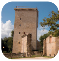
La tour de l'Honneur [J-9]

Au départ de la Porte Royale vous visitez la chapelle, la poudrière, la boulangerie ou encore le musée de l'histoire du village pour vous plonger au cœur d'une histoire passionnante !