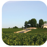
La Route des Châteaux,

Au fil de votre visite, vous y découvrez notamment son déambulatoire, son clocher octogonal et ses décors sculptés de grande qualité.