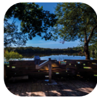
La réserve naturelle d'Hourtin et la lagune de Contaut [L-4]

Vous y apercevrez le seul théâtre gallo-romain du Sud de la Garonne.