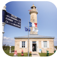
Le phare de Richard et sa vue sur l'estuaire de la Gironde [E-9]

Au gré de vos déambulations, vous traverserez les prestigieuses appellations Médoc, Haut Médoc, Margaux, Pauillac, St Estèphe, St Julien, Moulis, Listrac et vous croiserez pas moins 60 Grands Crus Classés en 1855, quelques centaines de crus Bourgeois, des dizaines de crus Artisans, des caves coopératives pour le plus grand plaisir de vos yeux et de vos papilles.